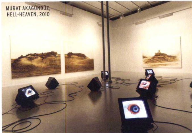
L'OFFICIEL | KASIM 2012