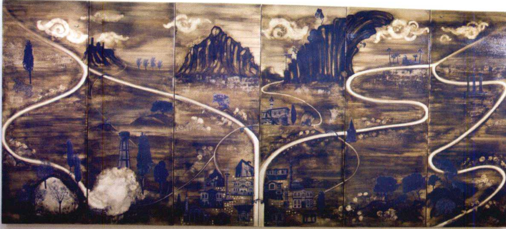
MURAT MOROVA, UNTITLED, 2011